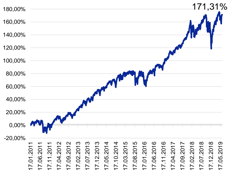
ДИНАМИКА ИНДЕКСА S&P500 С УЧЁТОМ ДИВИДЕНДОВ*